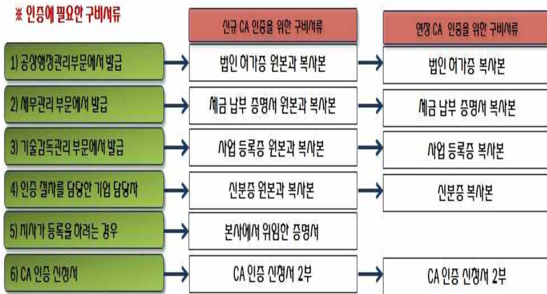
< 북경시 CA 인증 및 연장 관련 구비서류 >

여기서 CA인증을 받으면 3년간 유지할 수 있으며 이후 재 신청을 통해 CA인증을 유지할 수 있다.