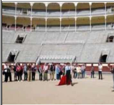
스페인 마드리드 투우장