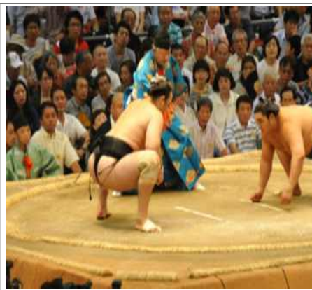
일본 오사카 스모경기장