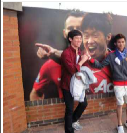
영국 맨체스터 유나이티드 축구 경기장 투어