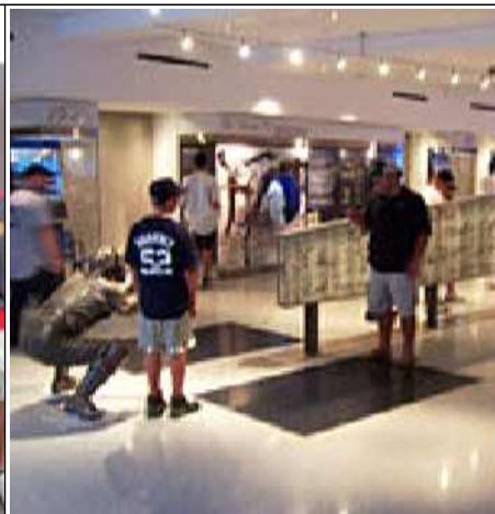
미국 뉴욕 양키스 야구 경기장 투어